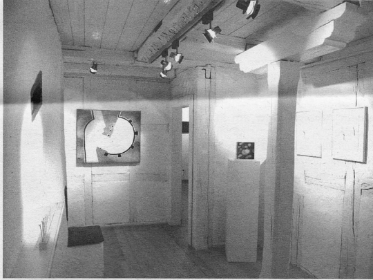
Ein Riegelhaus aus dem 17. Jahrhundert bildet den passenden Rahmen für die Ausstellung

Die deutsche Künstlerin bestickt Steine. Sie verbindet so verschiedene, ganz unterschiedliche Materialien